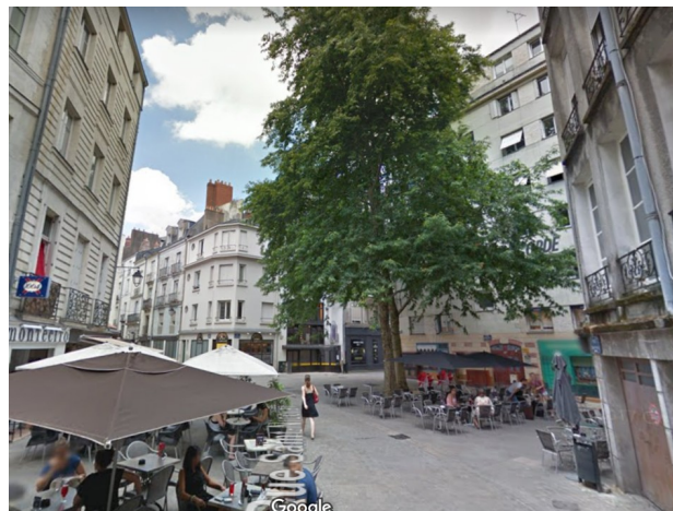
Rue Saint Nicolas - Nantes

Personnes à mobilité réduite (PMR) : L'aire piétonne étant un espace sans réelle délimitation, des techniques doivent être trouvées pour faciliter l'accès aux PMR et leur donner des repères pour la déambulation en toute sécurité. Il est particulièrement important de créer des éléments de guidage (par exemple : une bordure basse inclinée, un séparateur central ou un « canifente »). Le sol doit être non meuble et non glissant, sans obstacle à la roue, à la canne et au pied. Attention à l'abus de pavés qui compliquent la circulation des personnes en fauteuil, caddies ou poussettes.