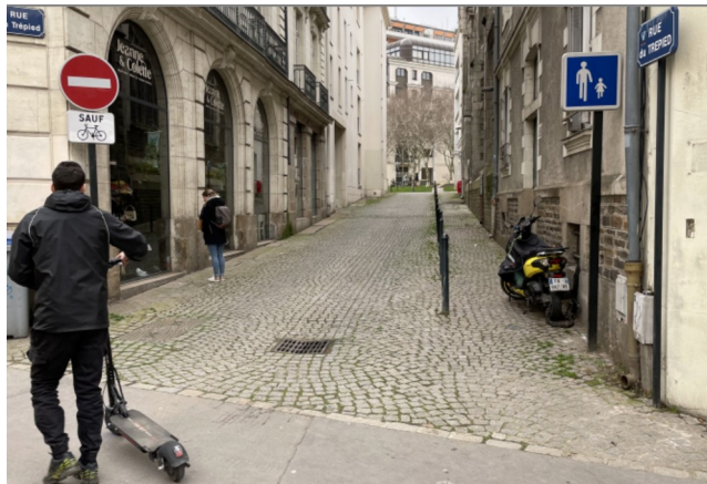
Rue du Trépied - Nantes

La signalisation verticale d'une aire piétonne est obligatoire, mais pas sa fermeture physique .