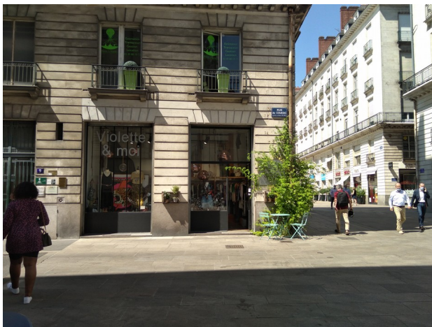
Rue du Couëdic – Nantes

Ces espaces en pied de façades participent au développement de la vie locale (une demande préalable d'autorisation d'occupation doit être faite pour les terrasses). Il est important d'y privilégier dès que possible les plantations en pleine terre qui participeront au « plan pleine terre » et au rafraîchissement de l'espace public. Cette végétalisation servira également à infiltrer l'eau pluviale ce qui contribuera au rafraîchissement de l'espace public.