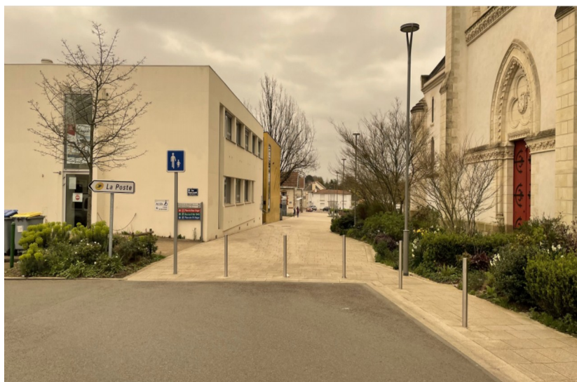
Fermeture par potelets - Rue Charles Callier (Vertou)