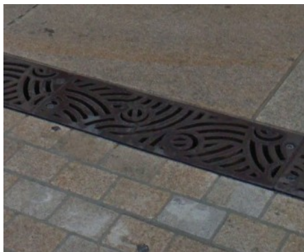
Place Graslin – Nantes