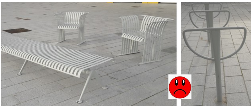
Espace piéton Confluent – Rezé Pont Rousseau

Il doit être rappelé combien il est important pour les personnes malvoyantes que le mobiliers urbain contraste avec l'espace environnant :