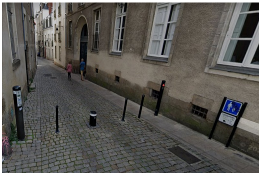
Fermeture par bornes - Rue Mathelin Rodier (Nantes)

Ces bornes n'ont pas d'effet sur les deux roues motorisés, qui peuvent toujours les franchir même si cela est interdit (hormis desserte).