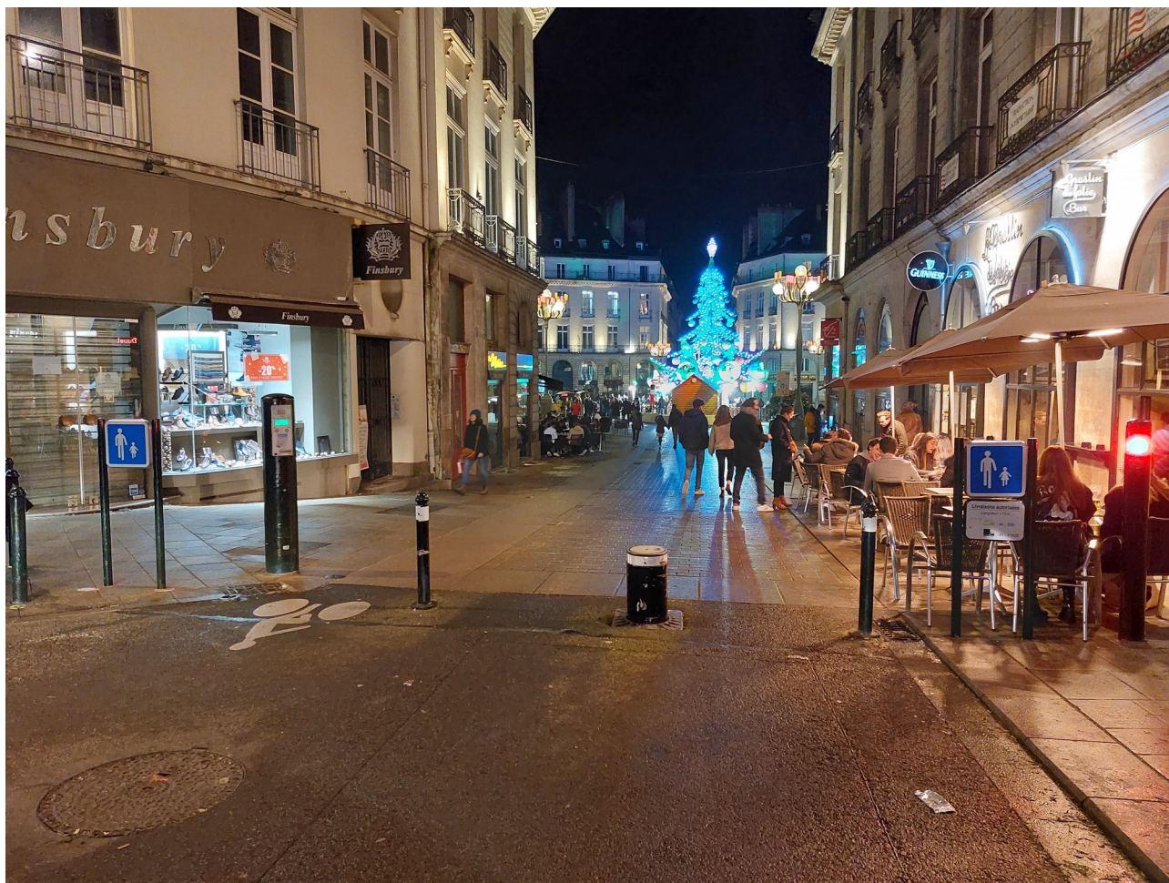
Place Graslin – Nantes

Les intentions et objectifs de la Métropole en terme d'ambiances nocturnes sont précisés dans le Schéma de Cohérence d'Aménagement Lumière (SCAL), associé à la charte d'aménagement et de gestion des espaces publics.