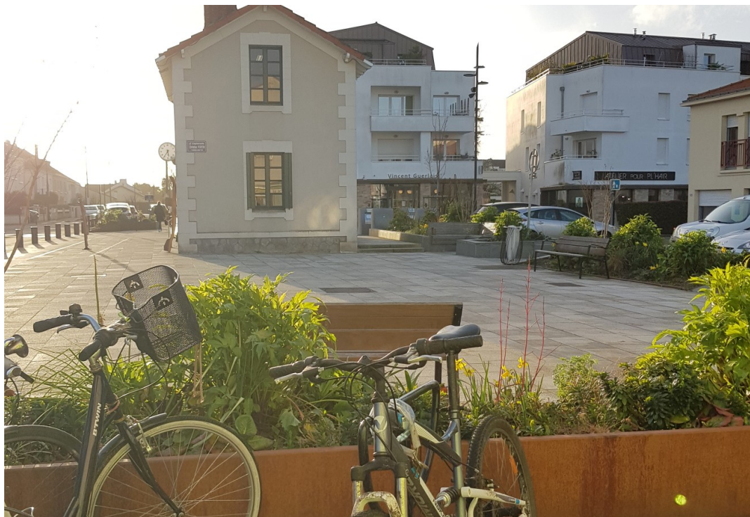
Esplanade Christian Fortin – St Sébastien sur Loire