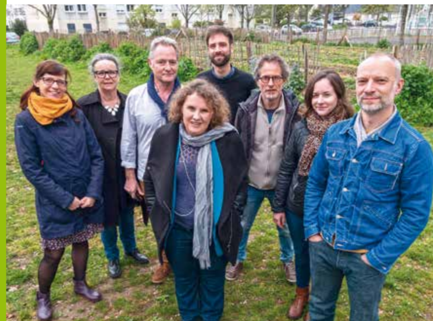
Direction de quartiers Nord (de gauche à droite)