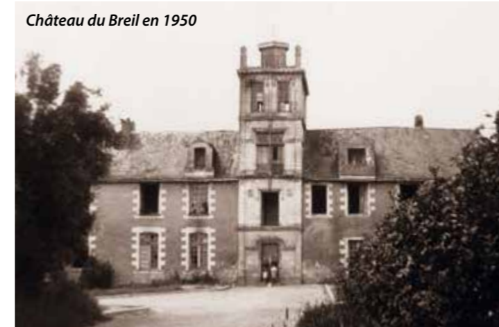
Château du Breil en 1950

Contact : Direction de quartiers nord - Alexandre Guérémy 02 40 41 61 63