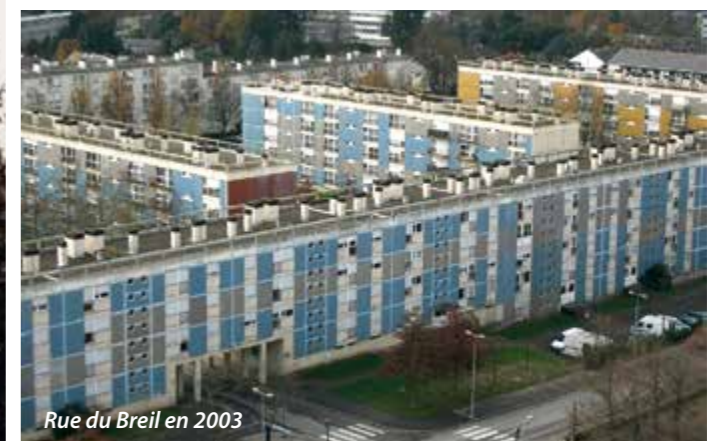
Rue du Breil en 2003