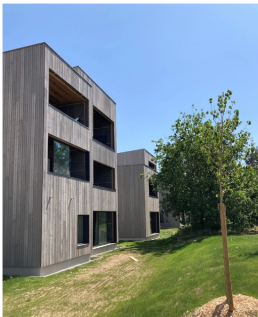
La résidence d'habitat participatif de NMH en juillet 2021 Photos libres de reproduction à télécharger sur https://we.tl/aQUuOcw97v (jusqu'au 17/10/21)

→ Plus d'information dans le communiqué de presse en pièce jointe.