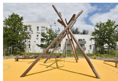
Le square Marie-Madeleine-Fourcade en juillet 2021 © Jean-Dominique Billaud / Nautilus Photos libres de reproduction à télécharger sur https://we.tl/t-nwhgqwTbEG (jusqu'au 18/10/21)