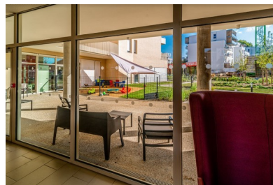
Le programme mixte construit par Atlantiques Habitations en juillet 2021 © Antoine Photographe Photos libres d'utilisation sous réserve de la mention du photographe : https://drive.google.com/drive/folders/1wzUEDhGwUhBjQ8rde75_YVKRaIgvXhr