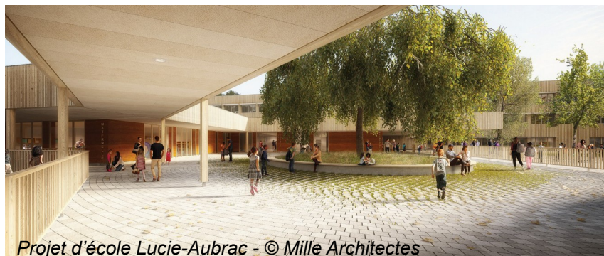
Projet d'école Lucie-Aubrac - © Mille Architectes