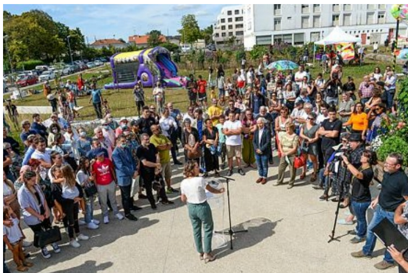
Inauguration du square et de la place Michelle Pallas