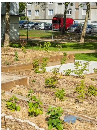
Potager sur l'espace public

L'aménagement de ce square a été réalisé par la direction Nature et jardins (ex-SEVE) de la Ville de Nantes avec les associations du collectif Lauriers Ensemble et des élèves du collège Debussy.