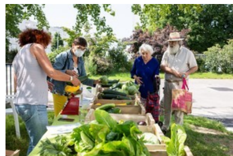
Distribution Nantes Paysages Nourriciers

En 2021, le Centre communal d'action sociale de la Ville de Nantes (CCAS) a poursuivi son engagement pour soutenir les Nantaises et les Nantais les plus vulnérables et lutter durablement contre la précarité et l'isolement. En cette année 2021, marquée une nouvelle fois par la crise sanitaire et les effets de l'inflation qui ont impacté le reste à charge des ménages les plus précaires, le CCAS a poursuivi ses actions et s'est adapté pour apporter des réponses concrètes, en proximité. Des projets ont vu le jour en faveur de l'inclusion sociale, à l'exemple de l'accueil de jour familles ou du projet partenarial des 5Ponts pour un accueil des personnes à la rue, et d'autres ont été pérennisés comme Nantes Paysages Nourriciers ou le maintien des portages de repas à domicile avec une tarification solidaire adaptée.