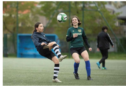
Groupement Féminin Nantes Est, club sportif football féminin, U15 et U19, quartier Doulon-Bottière

À Nantes, sur près de 50 000 licenciés masculins et féminins, adhérents à une fédération sportive de Nantes, près de 40 % sont des femmes. 2