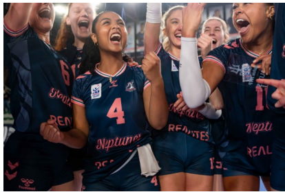
Joueuses des Neptunes